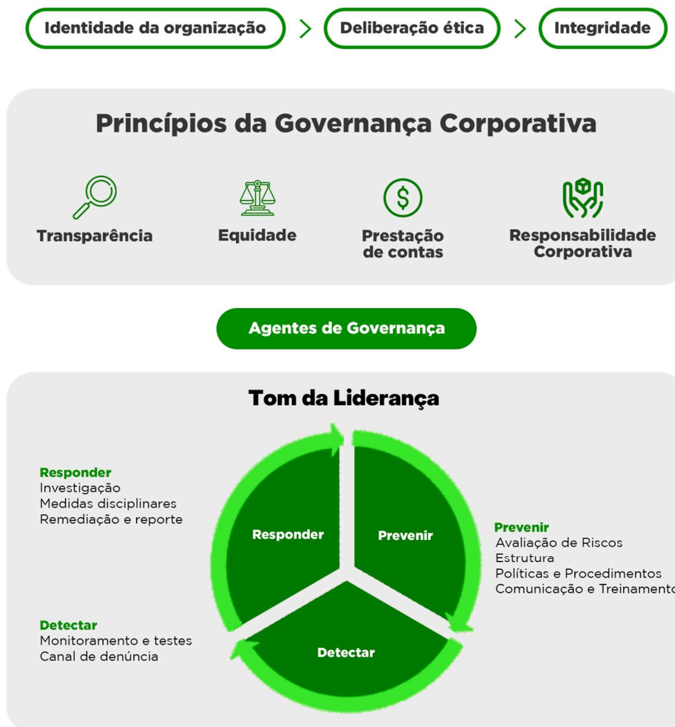
Figura 1 – Sistema de Compliance da POTIGÁS – adaptado do “Compliance à Luz da Governança Corporativa” do IBGC

A Figura 1 abaixo resume a funcionamento do Sistema de Conformidade/Compliance: