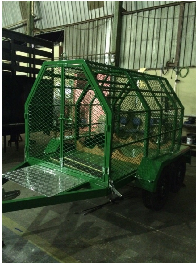
Figura 02 – Aspecto da carreta GNC (foto meramente ilustrativa)