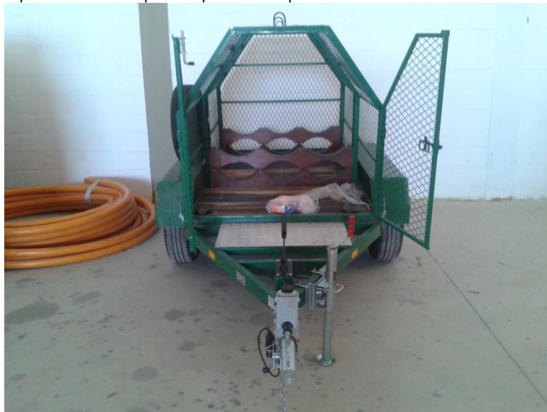
Figura 01 – Aspecto da carreta TIPO REBOQUE sobre a qual será instalado o cesto de cilindros (foto meramente ilustrativa)