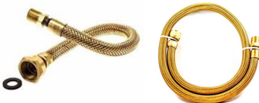
3.15.2. Imagem ilustrativa 05 – Tubo flexível metálico