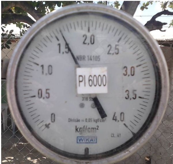
Figura 6 (ex: 1,6 kgf/cm 2 )