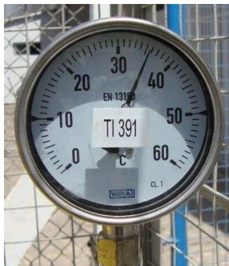
Figura 8 (ex: 35,5 °C)

5.3.3.1. Coletar/registrar a leitura indicada no termômetro (TI) à jusante do medidor de consumo de GN, contendo sempre o primeiro algarismo decimal (figura 8). Para registrar esse dado é necessário que haja vazão de GN (cliente esteja consumindo no momento da leitura).